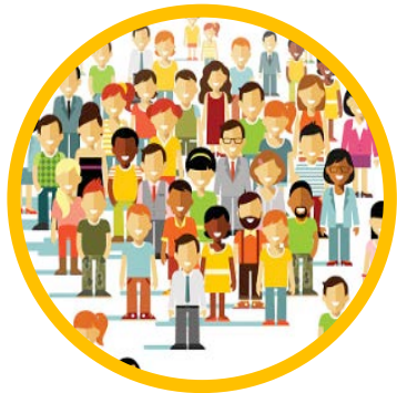
AUTONOMIES des PRODUCTEURS