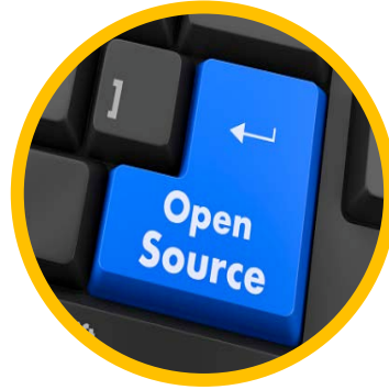
PLATEFORME OPEN SOURCE