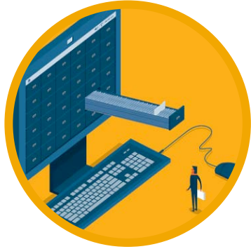
DEPOT OPEN DATA